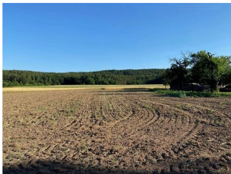
Grundstück Bild 2.JPG