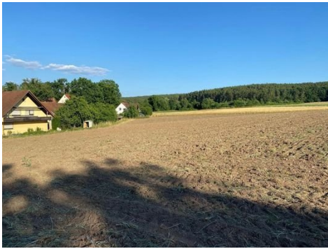
Grundstück Bild 1.JPG