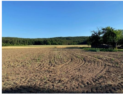
Grundstück Bild 2.JPG