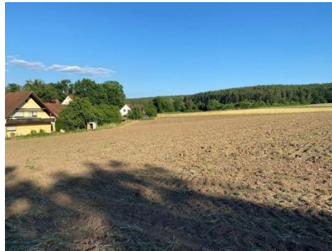
Grundstück Bild 1.JPG