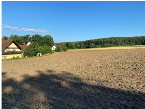
Grundstück Bild 1.JPG