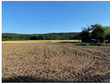
Grundstück Bild 2.JPG